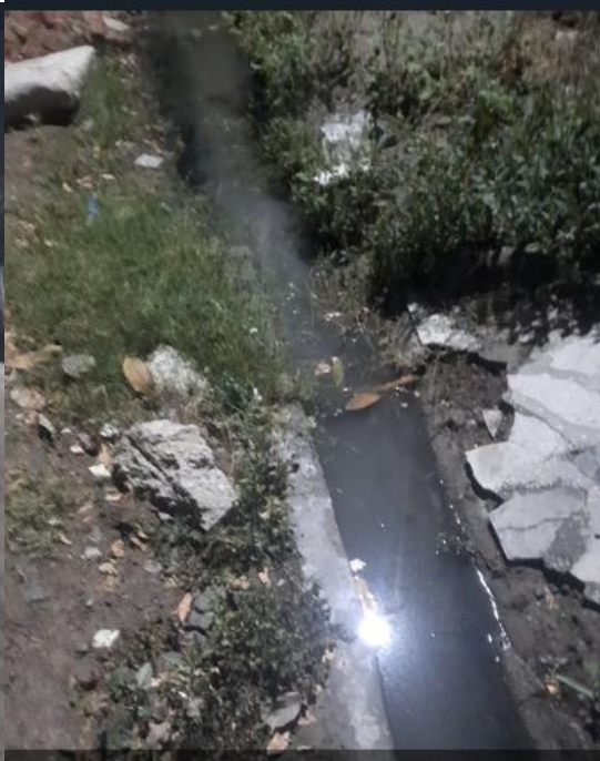
75, Nalanda Town, Village Rajrai, Agra, Uttar Pradesh 282004, India, Lat: 27.123253, Long: 78.045483 20 Mar, 26, 10:15 pm, Friday