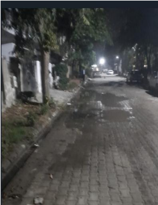
35, Nalanda Town, Rajrai, Agra, Uttar Pradesh 282004, India, Lat: 27.123640, Long: 78.045080 20 Mar, 26, 10:11 pm, Friday