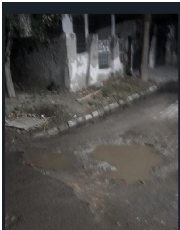
36, Nalanda Town, Rajrai, Agra, Uttar Pradesh 282004, India, Lat: 27.123653, Long: 78.044926 20 Mar, 26, 10:18 pm, Friday